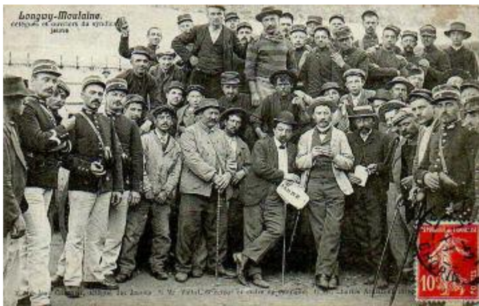
Délégués et ouvriers du syndicat jaune à Longwy - Moulaine

D'autre part, le syndicalisme jaune fut représenté par un seul « théoricien », une espèce de chef charismatique dans son milieu, ce qui n'a donné aucune perspective de développement au mouvement après son départ du très certainement à la résolution de se rendre au principe de réalité à savoir l'impossibilité de monter une organisation syndicale réellement concurrente de la CGT révolutionnaire qui affichait, elle, une belle vitalité.