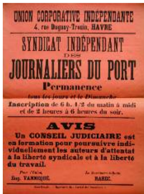
Autre tract de l'Union Corporative Indépendante adressé cette fois-ci aux journaliers du port

Le Premier juillet 1903, le journal des Jaunes « le Travail libre » qui a succédé à « L'Ouvrier indépendant » rend compte du local de la première bourse libre du travail au 14, Rue de la Corderie du Temple à Paris.