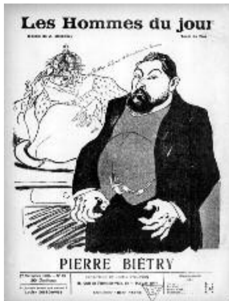
Caricature de Pierre Biétry dans le n° 42 de la parution « Les hommes du jour » en 1908.

Concernant la religion, Biétry indique que le Juif s'est installé dans nos foyers : « Comment se fait-il, enfin, que toujours les Juifs mettent le reniement de Dieu, du Dieu des chrétiens seulement, à la base de leurs spéculations économiques, intellectuelles et politiques, et par quels arguments leurs défenseurs peuvent-ils expliquer qu'après avoir persécuté, spolié, chassé de leurs églises les chrétiens ils en soient encore à prétendre que ce sont eux les opprimés ? »