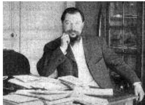
Pierre Biétry (1872-1918) qui fut le principal dirigeant de la F.N.J.F (Fédération nationale des Jaunes de France) de 1902 à 1912

Sans revenir sur l'origine du terme « jaune » lors d'une grève à Monceaux-les-Mines, il importe de retenir que l'emblème des Jaunes est le genêt par opposition à l'églantine des syndicats rouges.