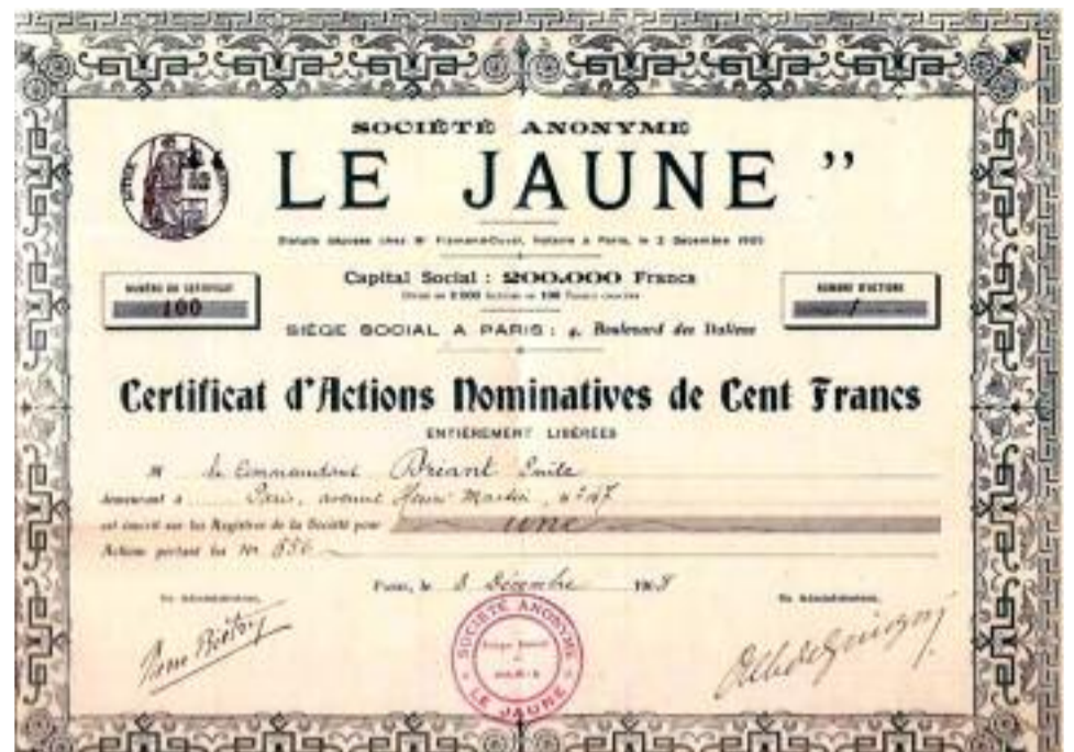
Titre financier signé par Pierre Biétry en 1903

un deuxième emploi en prenant des places dans l'industrie et le commerce, à plus bas prix. Les 450 000 fonctionnaires qu'il recense sont donc considérés comme les concurrents des travailleurs qui nivellent par le bas les salaires.