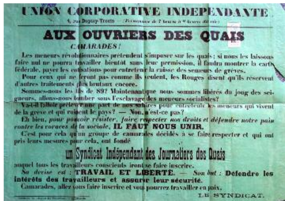
Tract de l'Union Corporative Indépendante en 1910

Il reproche aux municipalités de financer « des agitateurs chargés de l'organisation révolutionnaire » et se félicite de voir certaines autorités réagir : « A Toulon, Alger, etc., etc., les municipalités harcelées par les syndicats anarchistes fermèrent aussi les Bourses ou supprimèrent les subventions ».