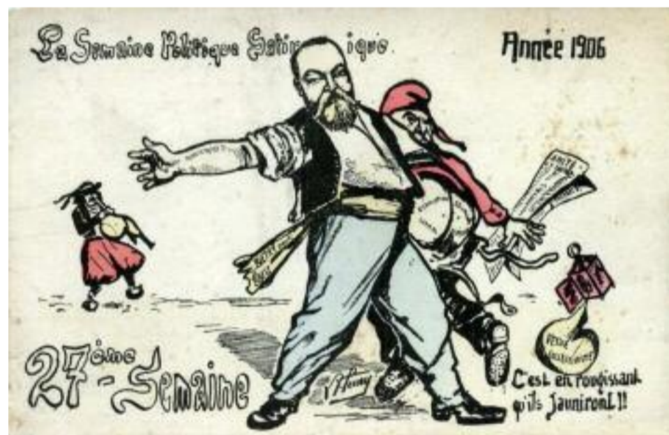
Dessin satirique représentant Biétry (journal La Lanterne en 1906)

« On le reconnaît de suite A l'atelier où il travaille Avec sa tête de jésuite Et son allure de valetaille. Il est le larbin du patron Qui semble lui faire une aumône, Il en subit tous les affronts, Le jaune.